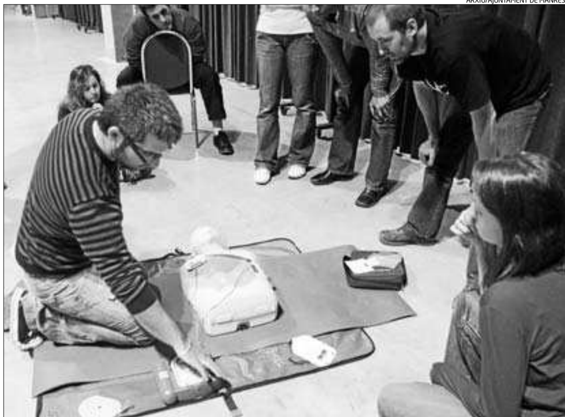
El curs de suport vital bàsic ensenya la forma d'ús dels desfibril·ladors

Les Jornades de Medicina tenen la inauguració a partir de les cinc de la tarda, i tot seguit comencen les sessions, que en el primer dia es relliguen en el títol «Interrelació entre esport i patologia mèdica». La moderadora serà la metgessa Car-