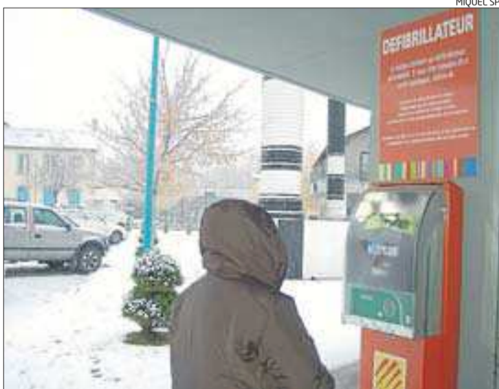
Una veïna, ahir, davant del desfibril·lador públic de la Guingueta d'Ix